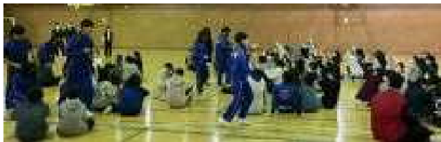
■ 新入生説明会・交流会 【3年生が児童に指示している様子】

2月15日、本校を会場に、森の里小・開西小6年生と保護者を対象に実施しました。この日は、緑園中3年生が中心となってイベントを運営し、