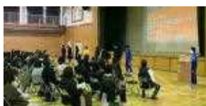
【3年生が保護者に説明している様子】

午前は両小学生の交流会（アクティビティ）、中学生の授業見学、校舎巡り、学校説明を行い、午後からは保護者向けの説明を行いました。