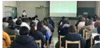
【学年懇談会の様子】

2月28日、今年度最後の学年・学級懇談会（1・2年生）を行い、約90家庭（半数以上）の皆様にご来校いただきました。最後までお付き合いいただいた皆様、大変お疲れ様でした。