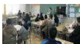
【学級懇談会の様子】

この一年、行事や懇談会等を通して、子どもを真ん中に、保護者同士、先生と保護者がつながる機会となりました。